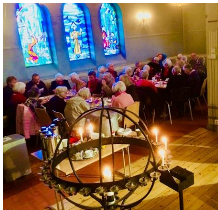
Samling etter Hverdagsmessen

Et av tilbudene til eldre er hverdagsmesse i Sandefjord kirke, som er en tilrettelagt gudstjeneste seks onsdager i året og hvor det tilbys hjelp til å komme til kirken. Musikk og opplegg er tilpasset den eldre generasjon. Hverdagsmessene er gjort kjent for dagsentrene i byen og annonseres.