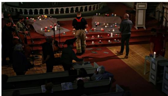
Du er ikke alene - Støttemarkering for etterlatte og berørte etter selvmord i Sandefjord kirke