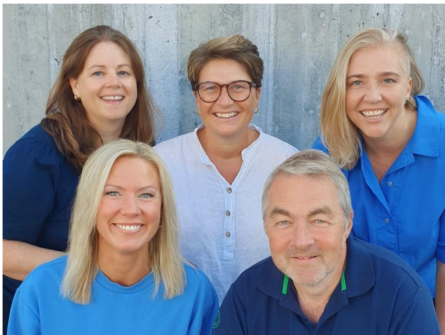
Våre dyktige medarbeidere som jobber i «13-20 Sandefjord»

Vi har et godt samarbeid med kommunens eget lavterskeltilbud i Psykisk helse barn og unge.