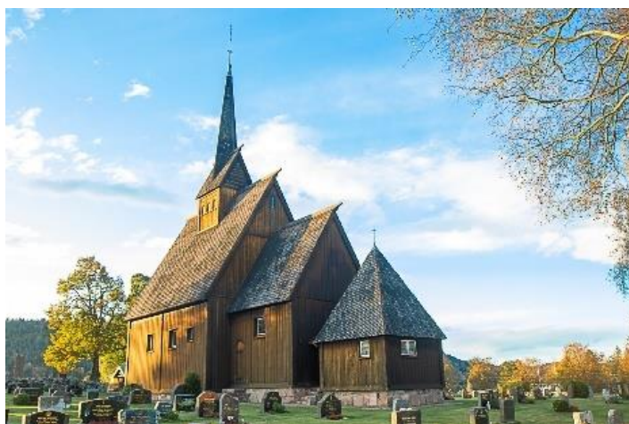
Høyjord stavkirke, den eneste stavkirken i Vestfold og den sydligste i Norge som har overlevd inn i vår tid fra middelalderen.

Vedlikehold av kirkene ivaretas av Sandefjord kommune og går inn som en del av den kommunale tjenesteyting. De årlige ordinære vedlikeholdsmidlene er forholdsmessig lave, dette nivået ønsker Sandefjord kirkelige fellesråd at skal oppjusteres. Sandefjord kirkelige fellesråd er imidlertid takknemlig for at kommunen har gitt ekstra bevilgninger til enkelte tiltak. Vi ber om at midler som kommunen har tilgjengelig brukes til å iverksette nødvendige tiltak. Vi ønsker videre at oppgradering av el-anlegg blir prioritert med hensyn på brannsikkerhet og mer effektiv energistyring av våre kirker.