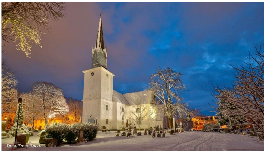
Sandar kirke, ferdig rehabilitert utvendig i 2021.

Med 4 middelalderkirker (Andebu, Kodal, Skjee og Høyjord stavkirke), tre listeførte kirker (Sandar, Sandefjord og Stokke), Arnadal kirke fra 1882 og to arbeidskirker (Bugården og Vesterøy) er vedlikeholdsbehovet stort.